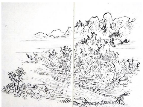
『時雨の山めぐり記』<保田家文書>にある長楽寺観音堂辺りと見られる挿絵(広島県立文書館蔵)

そこで、アストラムライン開業 30 周年の節目に、今も昔も人々の往来の要衝となっている安佐南区内のアストラムライン沿線の過去・現在・未来を紹介するパネル展や講演会、沿線周辺の散策会を行います。