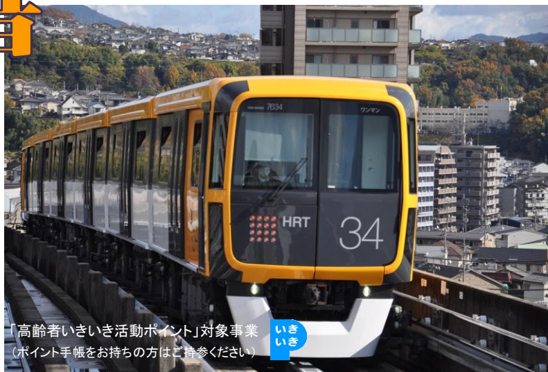
「高齢者いきいき活動ポイント」対象事業(ポイント手帳をお持ちの方はご持参ください)

対象 できるだけ、第1・2回通して参加できる方。第3回散策は1・2回参加者のうち希望者。 会場 安公民館(広島市安佐南区上安二丁目2番46号)※できるだけ公共交通機関等でご来場ください 申込 9月1日(日)午前9時から、安公民館の窓口または電話(082-872-4495)で。先着40人