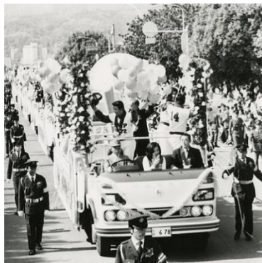
昭和50年 平和大通りでのカープ初優勝パレード

新幹線の広島開通、カープ初優勝、基町再開発事業、そして広島市が政令指定都市になった時期です。